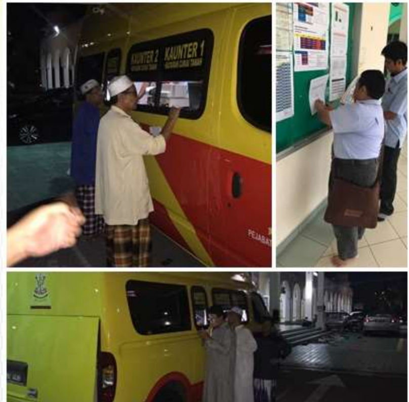
Tempat : Perkarangan Masjid Jamek Sultan Hisamuddin BBST